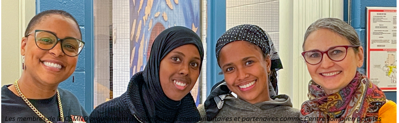
Les membres de la CSMNO provenant de diverses communautés et partenaires comme Centre somalien pour les services familiaux et le cadre de développement communautaire.