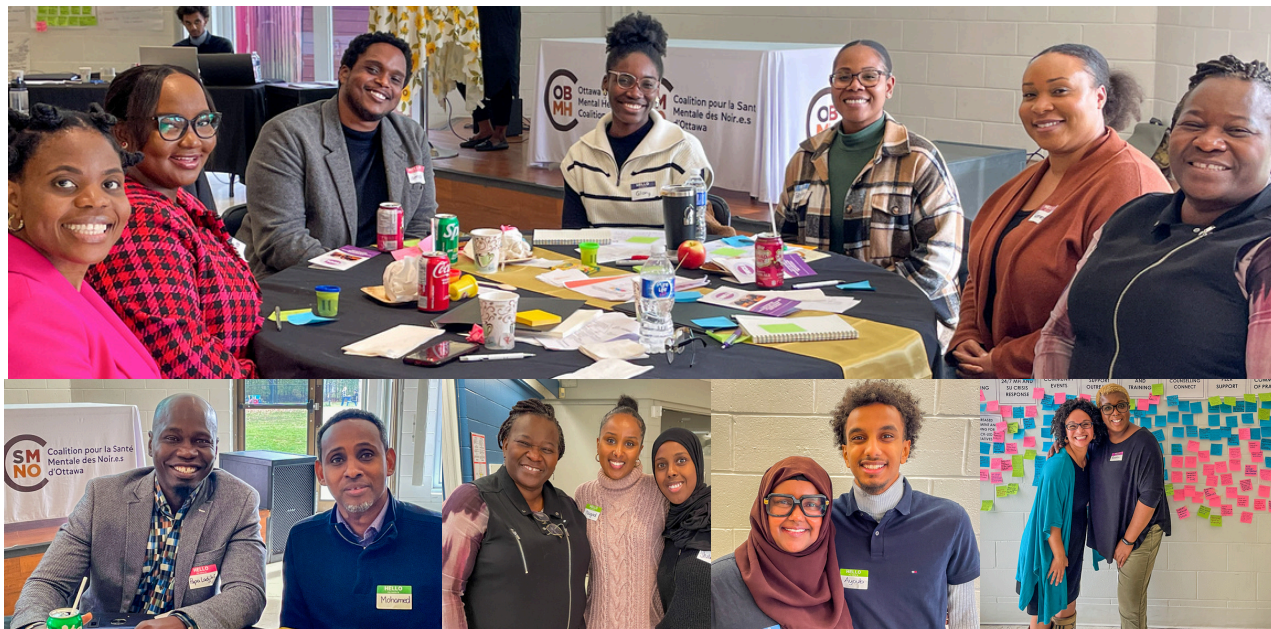
Des représentants de Salus, Britannia Woods, Amythest Ottawa, Somerset Ouest, Unis pour tous, l'Université d'Ottawa et d'autres se sont joints au personnel de l'OBMHC et à Sayid Consulting le mois dernier.